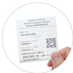
기존 교부식 입국심사증

2022. 9. 22. 부터 입국심사증의 발급 양식이 기존의 교부식에서 여권 부착식으로 변경되며, 새 양식으로 QR코드 인식을 통한 외국인 숙박신고가 가능해집니다.